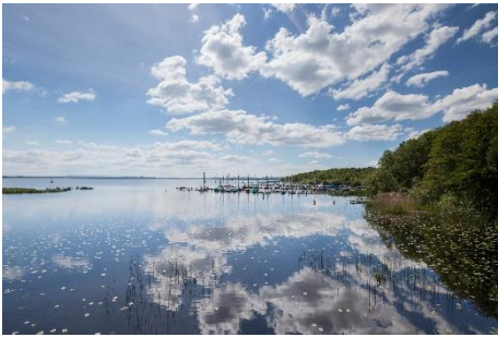
Naturpark Steinhuder Meer