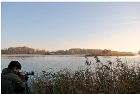
Beobachtungen Wentowsee, Naturpark Uckermärkische Seen; © L.Ripatti