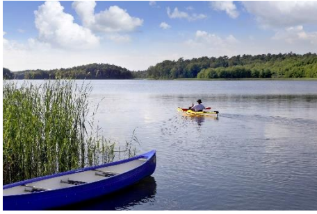
Großer Zecher Schaalsee, Naturpark Lauenburgische Seen