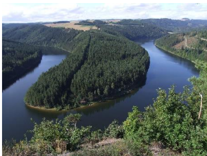
Saalebogen bei Paska, Naturpark Thüringer Schiefergebirge / Obere Saale