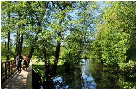
Naturpark Schwalm Nette; © NPSN Joschka Meiburg