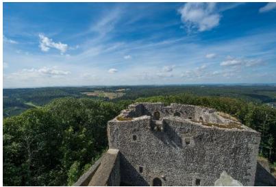
Naturpark Habichtswald