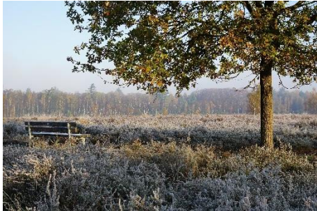
Schwalmbruch, Naturpark Schwalm Nette; © NPSN Baier