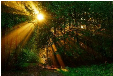
Naturpark Lauenburgische Seen