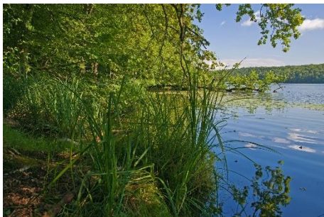
Lütauer See, Naturpark Lauenburgische Seen; © Thomas Ebelt