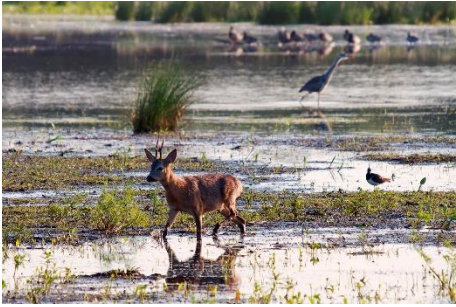
Naturpark Steinhuder Meer, Tiere in den Meerbruchwiesen; © Bernd Wolter